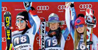
DISCESA LIBERA - DOWNHILL - 25 Gennaio/January