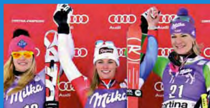
SUPER G - 26 Gennaio/January